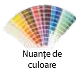
Nuanțe de culoare